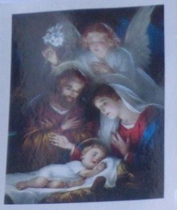
„Błogosław Panie temu domowi i wszystkim w nim mieszkającym”

Pomóż światu zwalczyć chorobę. Pozwól mi się cieszyć z prostych rzeczy jak dawniej to było Abym mogła tak jak dawniej spotkać się z koleżankami, kolegami, wrócić do szkoły, do pań Amen.